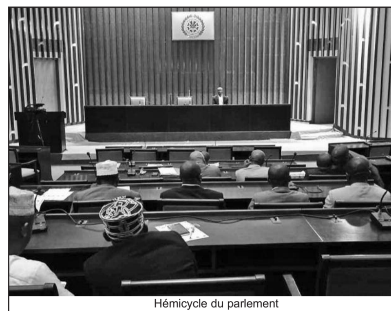
Hémicycle du parlement